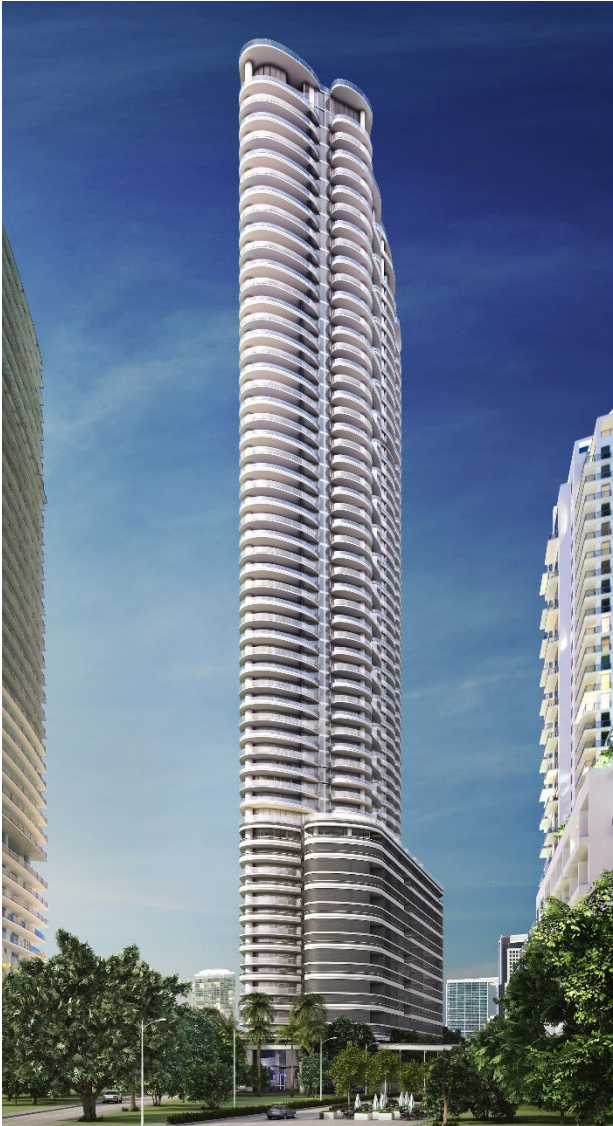
Brickell Flatiron Bulding, Miami Luxottica